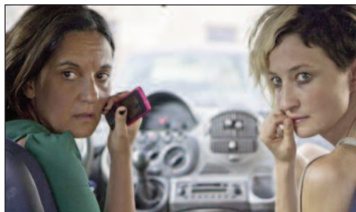
PALERME d'Emma Dante