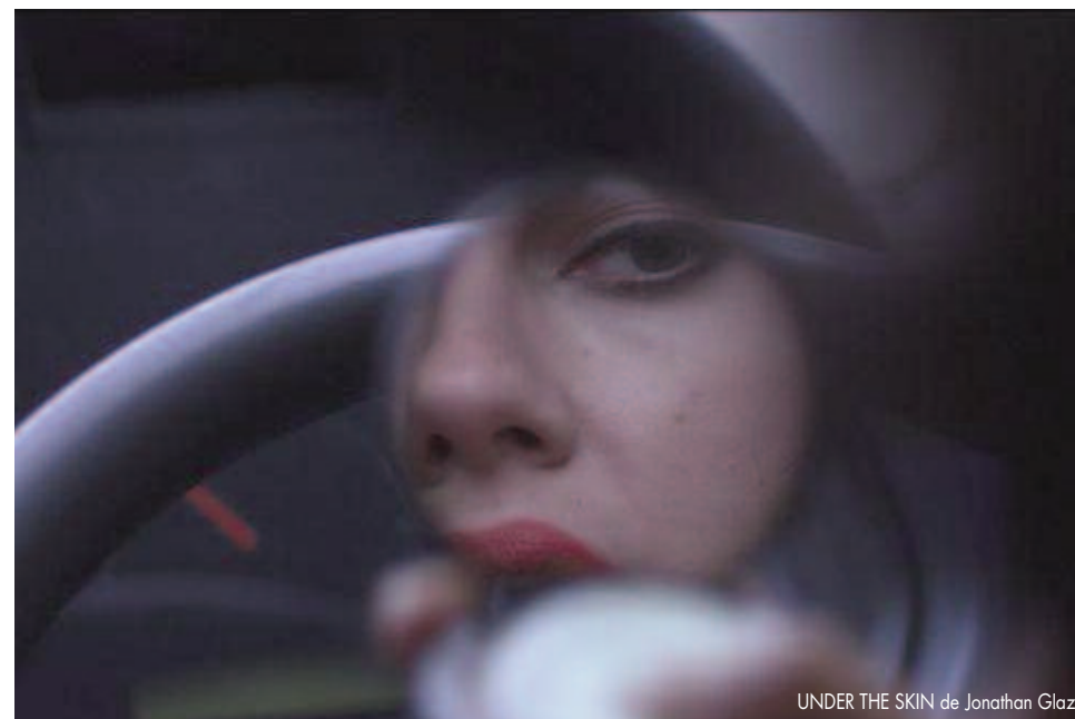
UNDER THE SKIN de Jonathan Glazer